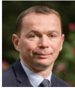
Olivier DUSSOPT Ministre du Travail, du Plein emploi et de l'Insertion

L'accès à l'emploi et à la formation professionnelle des jeunes est une priorité constante de mon ministère et de notre majorité depuis 2017. Cette ambition se traduit par notre volonté de trouver une solution pour chaque jeune, quel que soit son parcours.